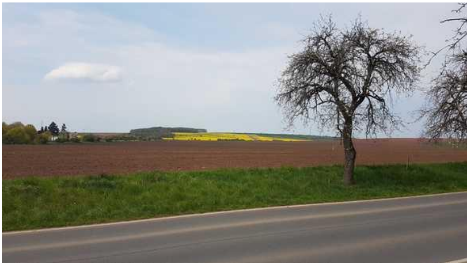
Pohled z ul. Klučovská