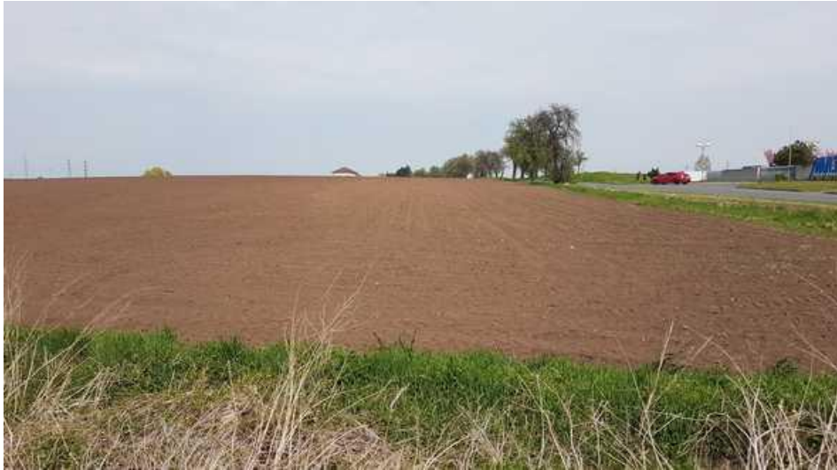
Pohled z ul. Za Drahou