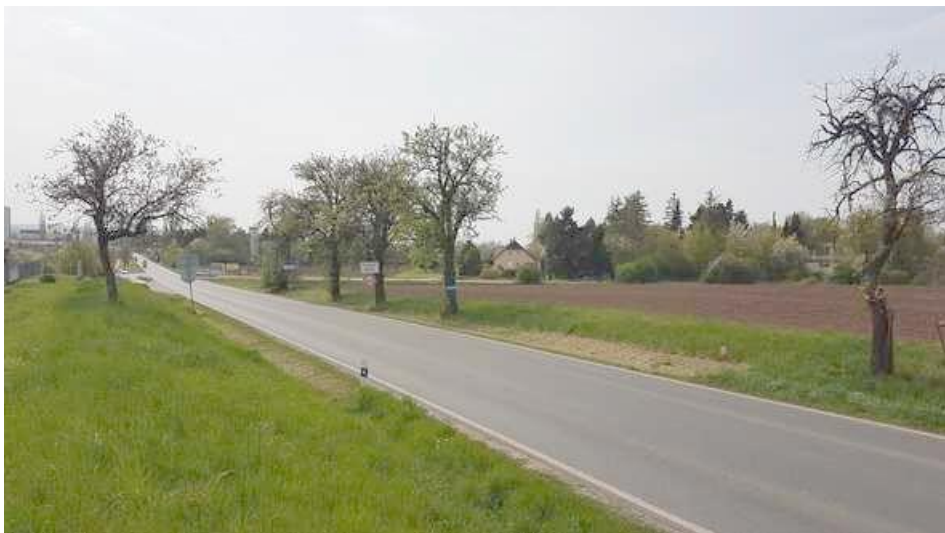
Pohled z ul. Klučovská směr Český Brod