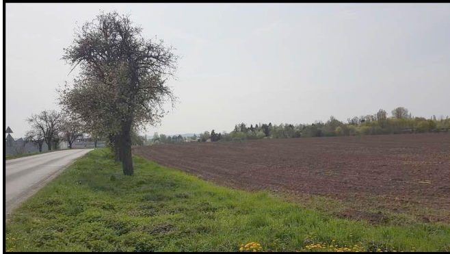
Pohled z ul. Klučovská směr Český Brod